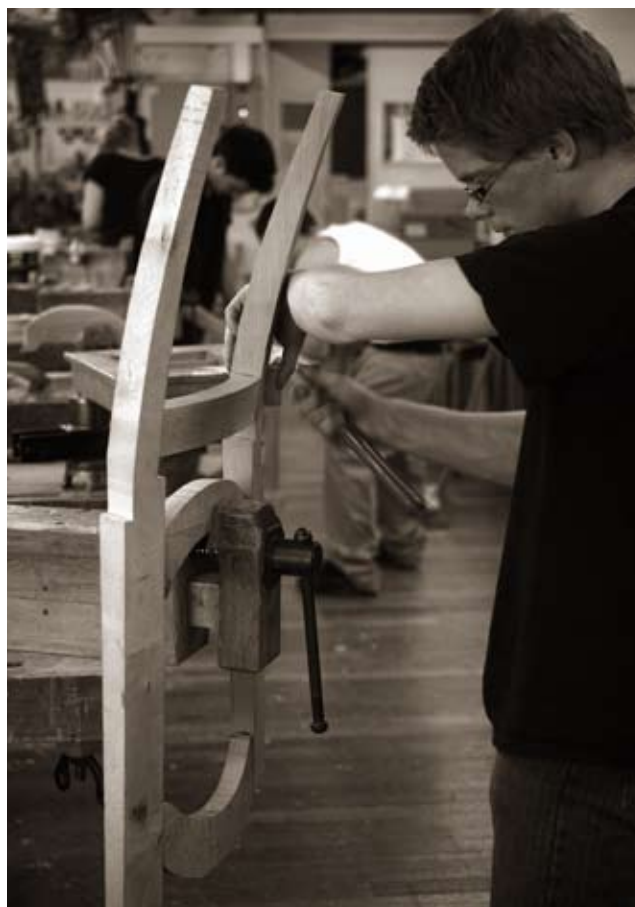
Ecole Boule, menuiserie