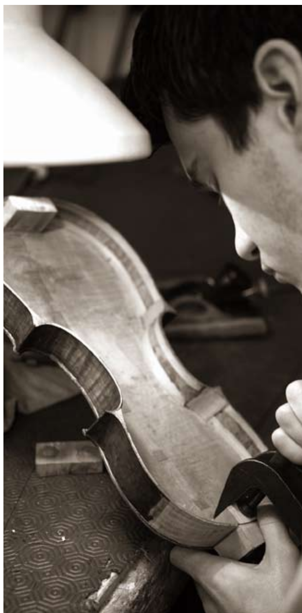
Luthier, atelier Vatelot Rampal

du CAP au Bac + 5 : écoles supérieures d'arts appliqués, lycées technologiques ou professionnels, Centres de Formation des Apprentis, universités et écoles privées, sans oublier les formations et cursus proposés par les Compagnons du Devoir ou les Chambres de Métiers et de l'Artisanat. À l'occasion des Journées Européennes des Métiers d'Art , dans nombre d'écoles ou de centres ouverts, laissez-vous surprendre par les réalisations des élèves comme par le savoir-faire et la passion de leurs enseignants.