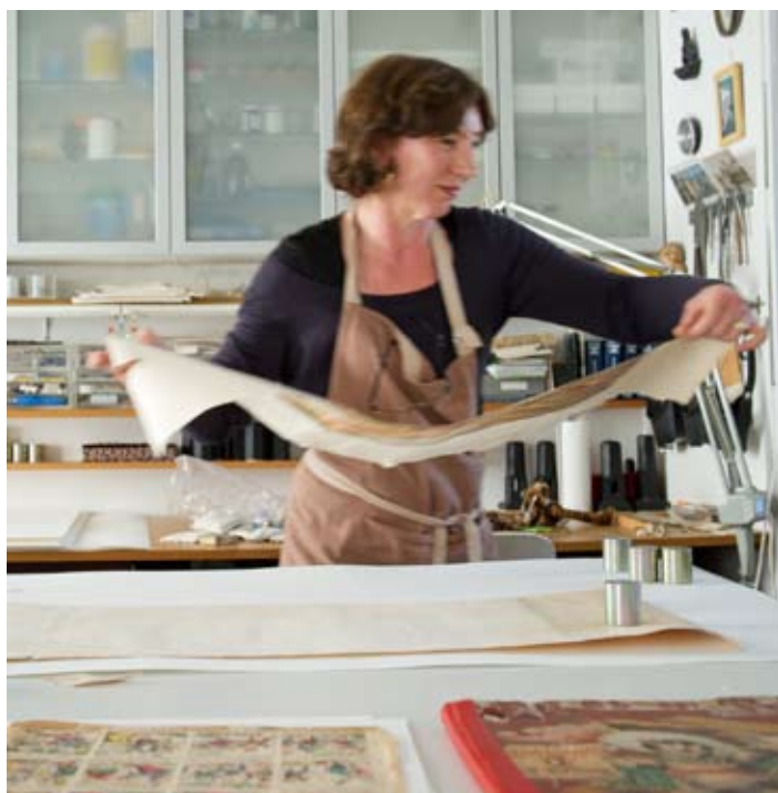
Atelier Beatrice de Cleat, restauratrice de dessins

> Musée du verre et du cristal, Place Robert Schuman 57960 MEISENTHAL Samedi et dimanche de 14h à 18h