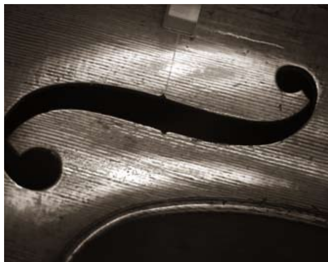
Atelier Vatelot Rampal, luthier

Vendredi de 16h à 19h et samedi de 14h30 à 18h