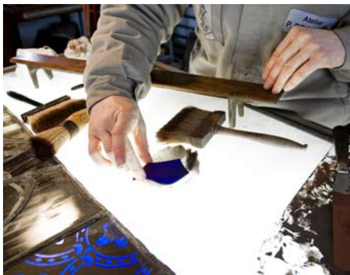
Atelier Luc-Benoît Brouard, vitrailliste