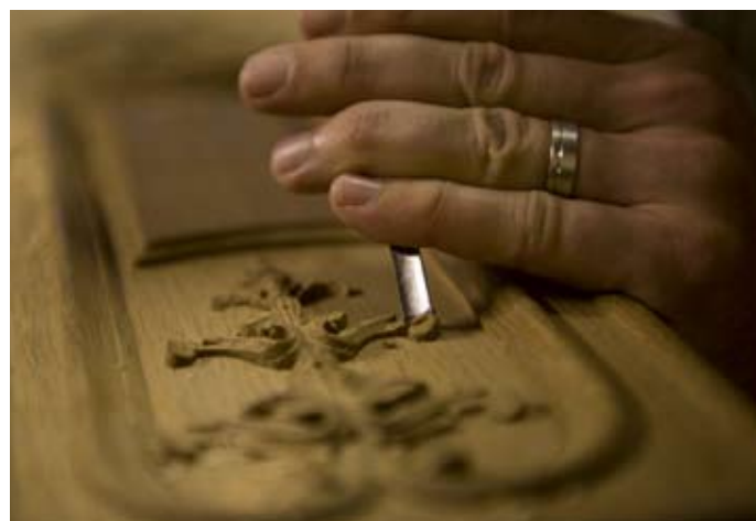
Maison Dissidi, ébéniste et sculpteur sur bois