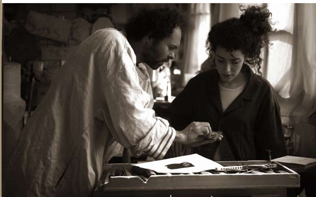
Ecole Boule, menuiserie