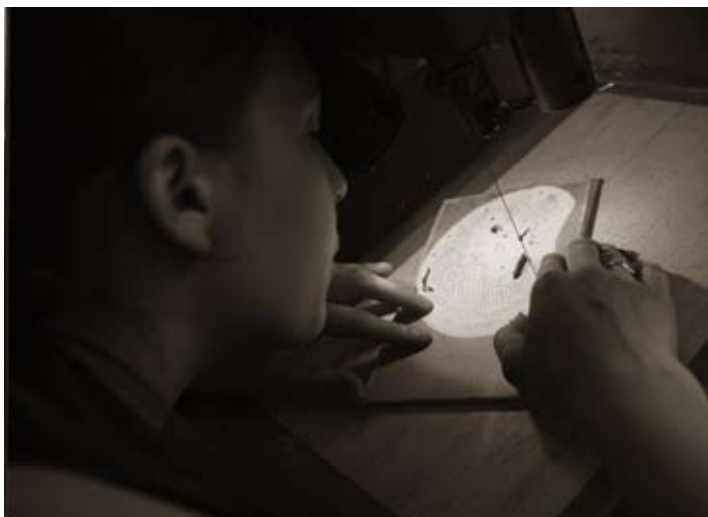
Ecole Boulle, marqueterie

> La Roche aux Fées 49220 LE LION D'ANGERS