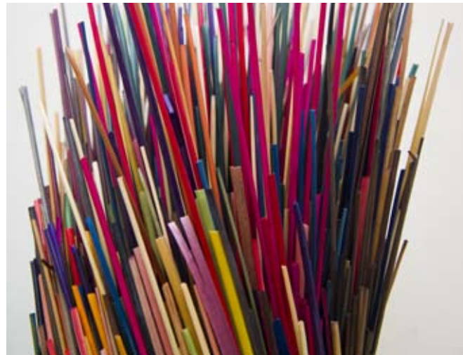
Marqueteur de pailles Atelier Lison de Caunes

Vendredi, samedi, dimanche de 10h30 à 12h30 et de 15h30 à 18h30