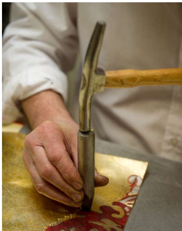
Ateliers Meriguet Carrère, peintre en décor

Vendredi, samedi, dimanche de 10h à 12h et de 14h à 19h