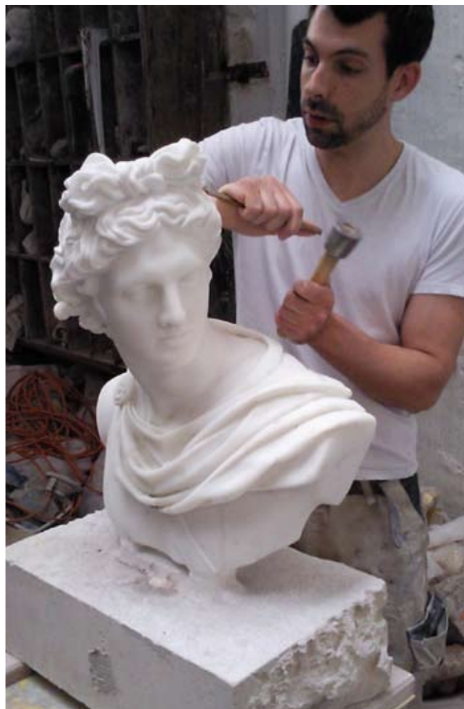
Marbrerie d'art Caudron