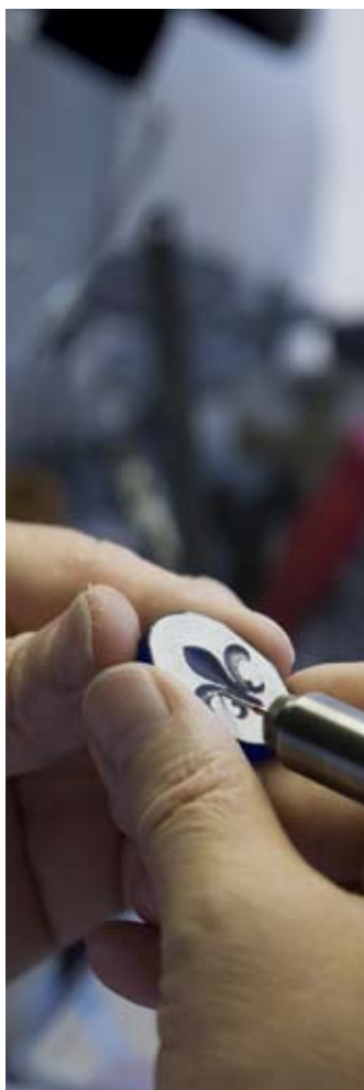
Atelier Claude Delhief, glypticien

Vendredi, samedi de 9h à 12h et de 14h à 19h